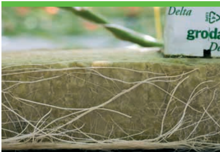
Er moet voldoende lucht in het substraat zitten; bij minder dan 70% vocht treedt meestal geen zuurstoftekort op.

tijdens de teelt de voedingstoestand van het substraat desgewenst snel kan veranderen.